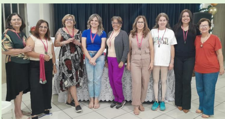
Medalhas: Velho e Novo Testamento