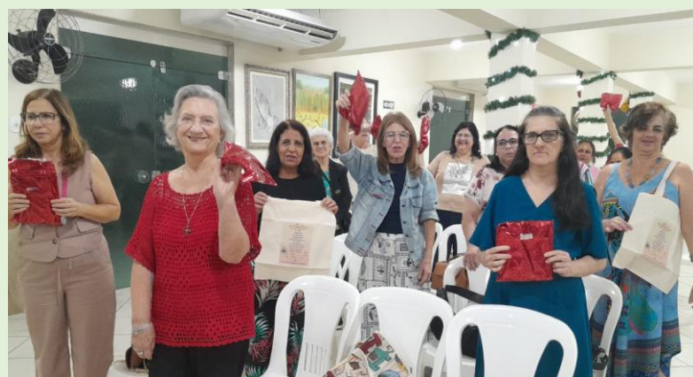
Entrega de mimos para todas