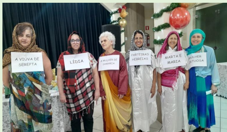
Mulheres da Bíblia estudadas este ano nas Reuniões Departamentais