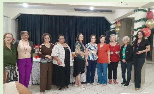
Oração das 21 horas