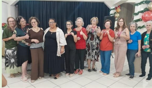
Oração online às 21h