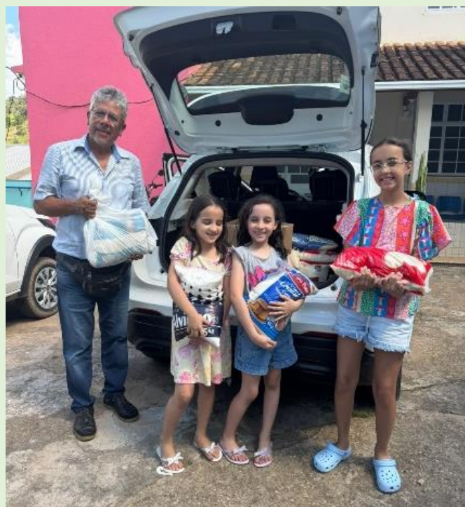
Entrega de alimentos na DAREI

A Junta Diaconal distribuiu para várias entidades filantrópicas alimentos arrecadados por ocasião do DIA NACIONAL DE AÇÕES DE GRAÇAS. Todos receberam com alegria e gratidão essas doações que demonstram que a nossa fé precisa ser comprovada por meio de obras. Ajudar aos necessitados agrada a Deus e abençoa muitas vidas. Parabéns irmãos Diáconos por excelente trabalho.