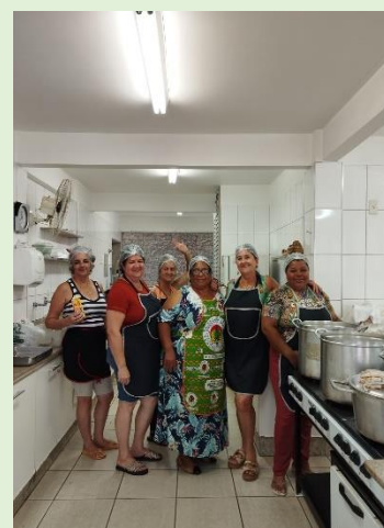
Apoio da SAF/IPM na preparação do jantar