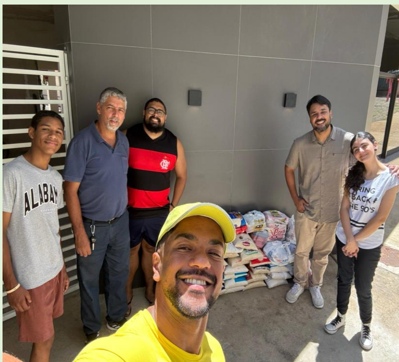
Entrega de alimentos no Asilo São Vicente de Paulo de Manhauçu