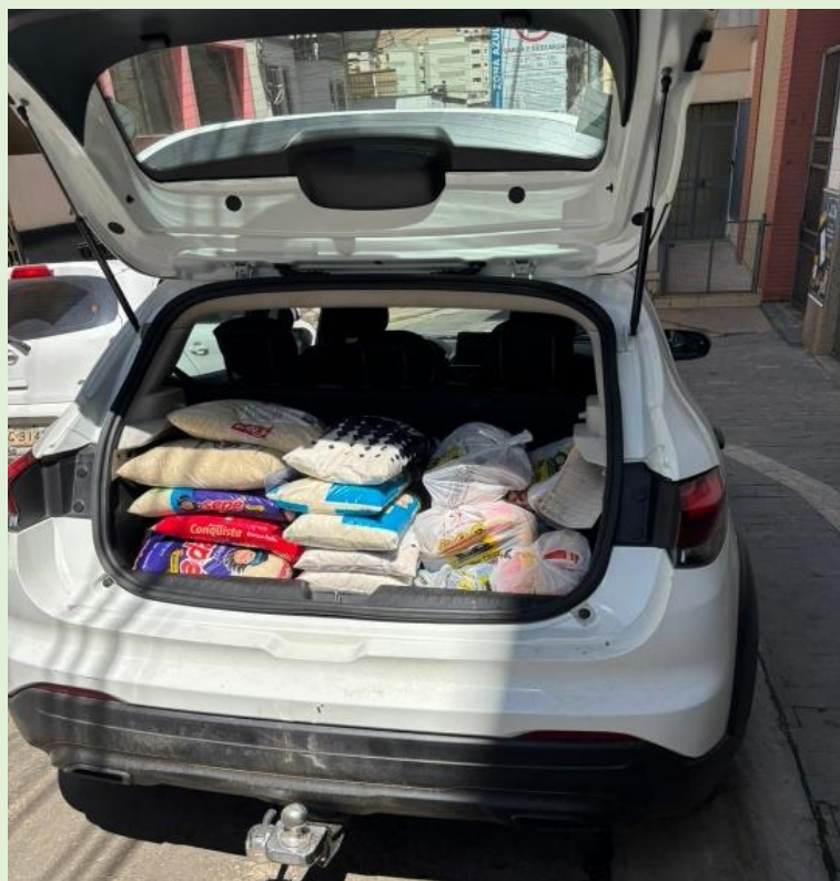
Alimentos para o Asilo São Vicente de Paulo de Manhauçu